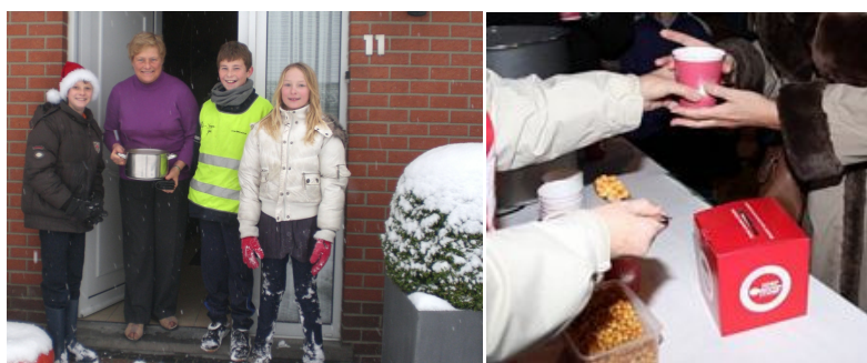
Ook aan de schoolpoort wordt die middag soep verkocht.